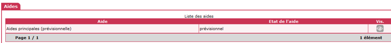
Tableau « Données générales du dossier »