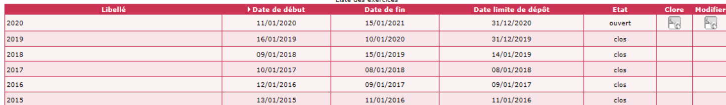
Liste des exercices

➤ Sélectionner l'année de gestion concernée et cliquer sur « ouvrir »