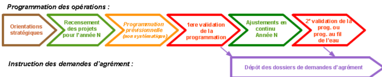
Tableau 1 : calendrier par territoire : différentes dates pour la programmation et l'instruction des opérations pour l'année 2016