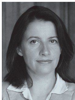
CÉCILE DUFLOT, Ministre de l'Égalité des territoires et du Logement

Vous pouvez compter sur ma détermination à les soutenir.